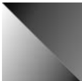
lana e viscosa Marek