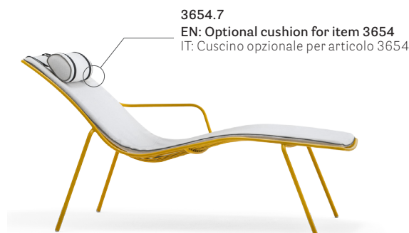
3654.7 EN: Optional cushion for item 3654 IT: Cuscino opzionale per articolo 3654