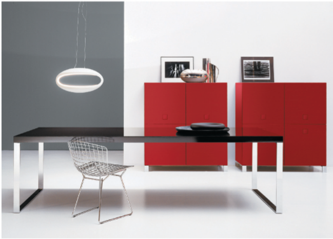
design Pietro Arosio

Per il tavolo rettangolare è possibile fissare le gambe alle estremità del piano oppure rientranti in qualsiasi posizione a discrezione del cliente.