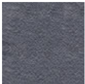
PL73 NERO PERLATO LUCIDO