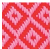
rouge - rose