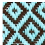
oxyde - bleu ciel