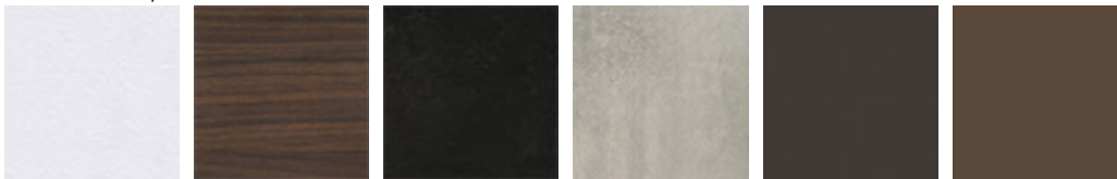
LM02 bianco climb